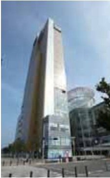
高松シンボルタワー